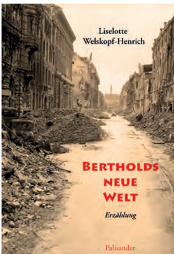
Liselotte Welskopf-Henrich Bertholds neue Welt Erzählung

Ein zwölfjähriger, in der Zeit des Krieges früh gereifter Junge, Berthold Wichmann, steht im Mittelpunkt der Handlung. – Seit wenigen Tagen schweigen die Geschütze in Berlin. Die Stadt ist