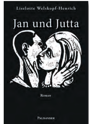
Liselotte Welskopf-Henrich Jan und Jutta Roman