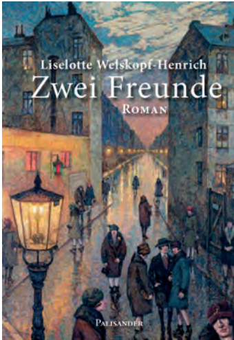
Liselotte Welskopf-Henrich Zwei Freunde Roman

Mit einem Nachwort von G. Noglik ISBN 978-3-957840-12-7 (e-pub) ISBN 978-3-957840-13-4 (mobi) ca. 1 200 Seiten; € 8,99