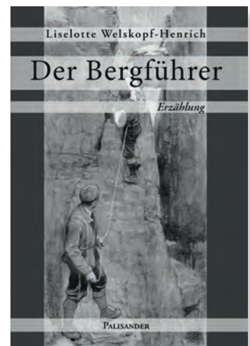
Liselotte Welskopf-Henrich Der Bergführer Erzählung

Welskopf-Henrich vereint in dieser Erzählung, die hier erstmals in ihrer Originalfassung veröffentlicht wird, ihre Liebe zu den Bergen mit ihrer unveröhnlichen Einstellung gegenüber jeder Art von »Herrenmenschen«, eindrucksvolle Landschaftsschilderungen mit prägnanten Charakterdarstellungen und spannender Handlung.